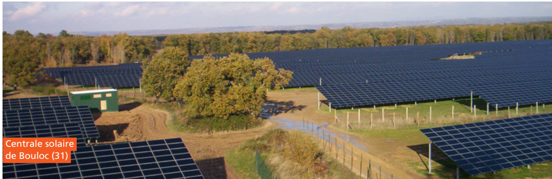
Centrale solaire de Bouloc (31)