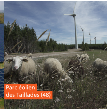
Parc éolien des Taillades (48)