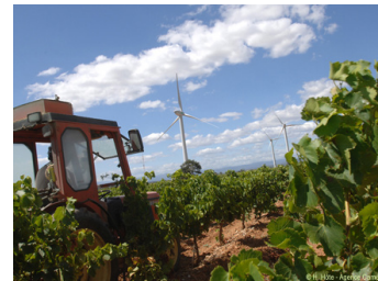
Parc éolien de Luc sur Orbieu (11)