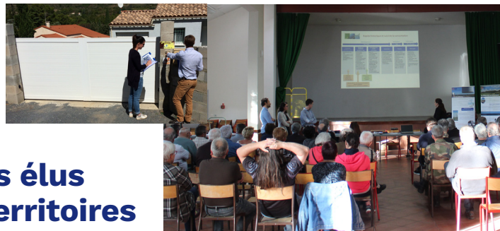
Porte à porte et réunions publiques

Aller à la rencontre de la population, sensibiliser au changement climatique, à l'environnement et au mix énergétique par des ateliers et des rendez-vous.